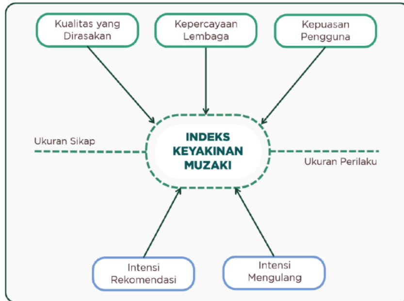
Gambar 1.1. Model Pengukuran Indeks Keyakinan Muzaki

“Kepercayaan Lembaga” menjadi faktor penentu dari tingginya IKM (Indek Keyakinan Muzaki) (Zaenal, 2023: 10).