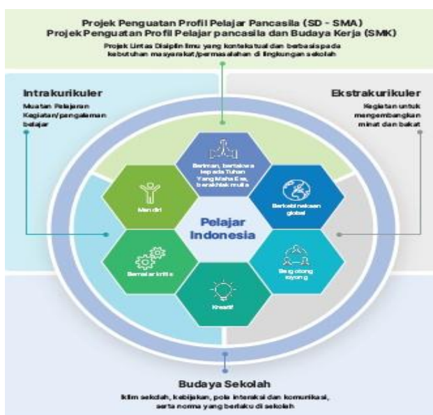
Gambar 2.2 Penerapan Profil-Pelajar-Pancasila di Satuan Pendidikan

Penerapan atau implementasinya Profil-Pelajar-Pancasila pada satuan pendidikan sebagaimana dapat disimak pada gambar di bawah ini.