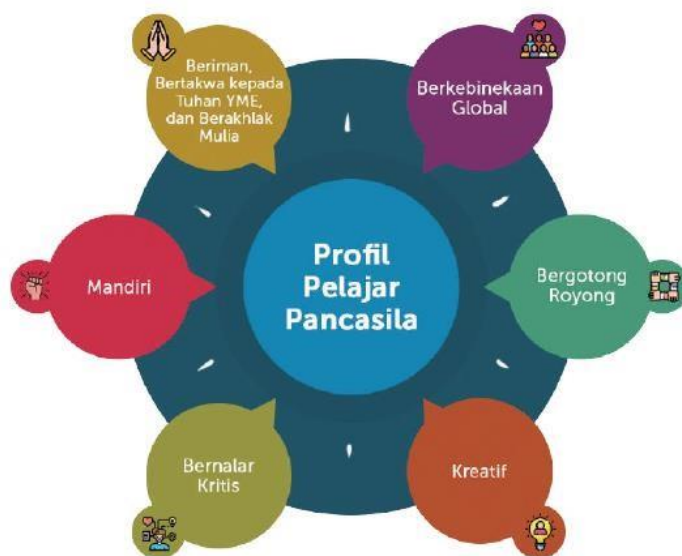
Gambar 2-1 Profil-Pelajar-Pancasila

Profil-Pelajar-Pancasila sesuai dengan yang termuat dalam Peraturan Menteri Pendidikan dan Kebudayaan Nomor 22 Tahun 2022 tentang Rencana Strategis Kementerian Pendidikan dan Kebudayaan tahun 2020 -2024. Dalam buku Panduan Pengembangan Projek Penguatan Profil-Pelajar-Pancasila, Enam dimensi yang perlu dibangun dalam menciptakan Profil-Pelajar-Pancasila menunjukkan tidak hanya berfokus pada kemampuan kognitif, tetapi juga sikap dan perilaku sesuai jati diri sebagai bangsa Indonesia sekaligus warga dunia. Adapun enam elemen Profil-Pelajar-Pancasila, yaitu: beriman, bertaqwa kepada Tuhan YME dan berakhlak mulia; berkebhinekaan global; bergotong royong; kreatif, bernalar kritis, dan mandiri.