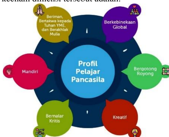
Gambar 2.1. Enam dimensi Proyek profil Pelajar Pancasila