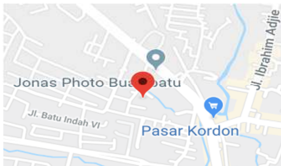
Gambar 5. Letak wilayah Pos PAUD Melati Bunda