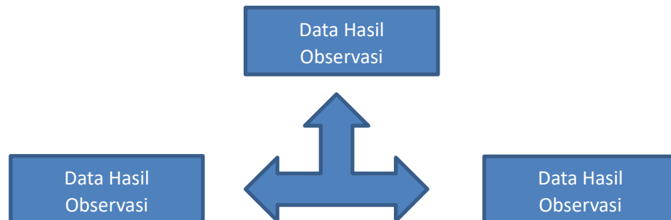
Gambar 3. Teknik Triangulasi dengan Sumber

Berdasarkan penjelasan diatas, maka teknik triangulasi yang digunakan pada penelitian ini dapat digambarkan sebagai berikut :