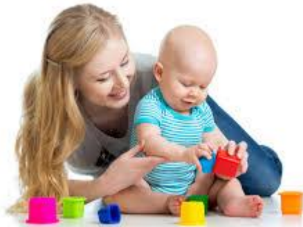
Gambar 4. Urutan (2-4 tahun)

Bayi akan mendekatkan benda kecil ke mukanya dan dari hal-hal yang detail sebagai kemajuan koordinasi mata-tangan yang semakin lama menjadi sempurna dan akurat.