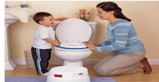
Gambar 6. Toilet Training (10 bulan-3 tahun)

Bila music merupakan bagian dari luasannya setiap hari, anak-anak akan menunjukkan keinginan yang spontan dalam intonasi, irama, dan melodi.