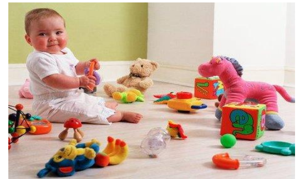
Gambar berbagai pilihan alat permainan yang diberikan pada anak sehingga anak dapat memilih

jumlah yang memadai agar anak dapat memilih. Biarkanlah anak untuk bebas memilih alat permainan atau kegiatan bermain yang sukainya. Permainan yang dipilihnya sendiri akan lebih memikat daripada yang disodorkan oleh orang lain. Walaupun demikian tidak berarti peran orangtua dan guru menjadi pasif. Orangtua dan guru tetap perlu memperkenalkan anak dengan berbagai jenis alat permainan yang dapat merangsang berbagai aspek perkembangannya secara optimal.