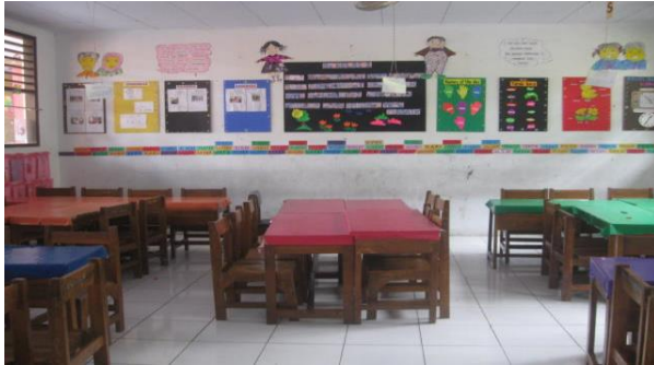
Gambar kelas TK dengan ruangan yang cukup luas dengan ukuran 8 x 8 meter untuk kapasitas maksimum 30 anak.

lintas di jalan atau dari adanya lomba/sungai.