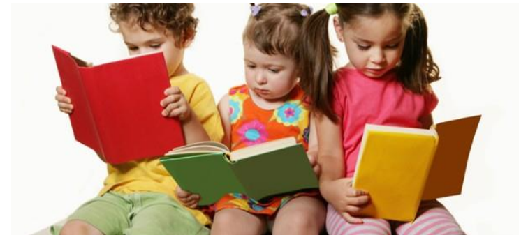
Gambar 10. Membaca (3-5 tahun)

Montessori menemukan bahwa keterampilan menulis mendahului membaca dan dimulai dengan usaha untuk memproduksi huruf-huruf dan angka-angka dengan pensil dan kertas.