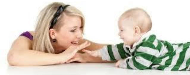
Gambar 2. Bahasa (Lahir - 6 tahun)

Gerakan acak bayi menjadi terkoordinasi dan terkontrol seperti halnya belajar menggenggam, menyentuh, berbalik, keseimbangan, merayap, dan berjalan.