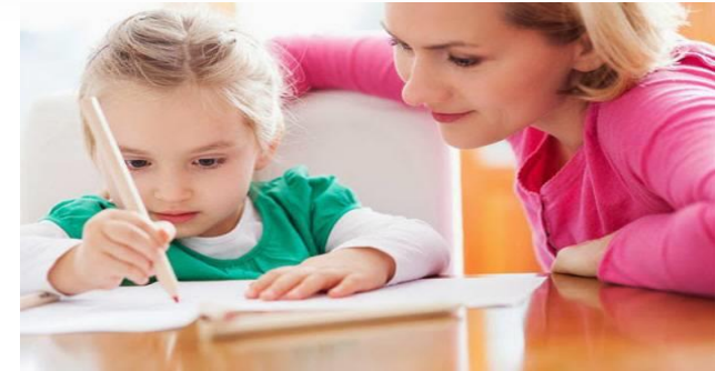
Gambar 9. Menulis (3-4 tahun)

Pendidikan penginderaan dimulai saat lahir, tetapi dari usia 2 tahun anak anda akan sangat menyukai pengalaman inderanya (merasakan dengan lidahnya, mendengar suara, menyentuh, dan mencium aroma).