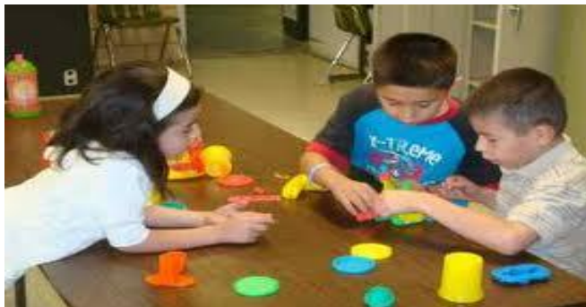
Gambar 11. Hubungan Spasial (4-6 Tahun)

Saat pemahaman hubungan bentuk-bentuk anak anda berkembang, ia akan mampu mengerjakan puzzle-puzzle yang sulit.