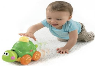
Gambar 3. Obyek kecil (1-4 tahun)

Bayi akan mendekatkan benda kecil ke mukanya dan dari hal-hal yang detail sebagai kemajuan koordinasi mata-tangan yang semakin lama menjadi sempurna dan akurat.