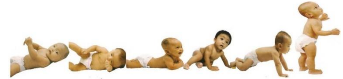
Gambar 1. Gerakan (Lahir-1 tahun)

Gerakan acak bayi menjadi terkoordinasi dan terkontrol seperti halnya belajar menggenggam, menyentuh, berbalik, keseimbangan, merayap, dan berjalan.