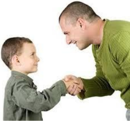
Gambar 7. Kehormatan dan santun (2-6 tahun)

Anak anda akan cinta akan kesopanan dan sikap yang bijaksana yang akan terinternalisasi kedalam kepribadiannya.