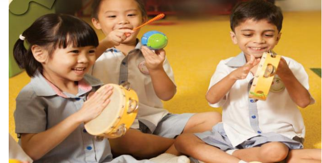
Gambar 5. Musik (2-6 tahun)

Segala sesuatu harus pada tempatnya. Tahapan ini merupakan ciri-ciri dari bayi kita yang suka terhadap hal-hal yang rutin dan keingintahuan pada konsistensi dan pengulangan.