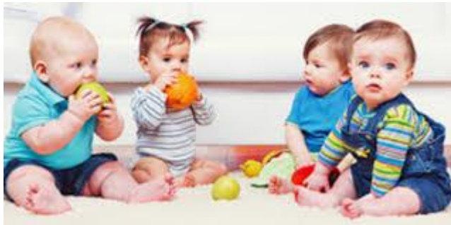
Gambar 8. Alat Indera (2-6 tahun)

Anak anda akan cinta akan kesopanan dan sikap yang bijaksana yang akan terinternalisasi kedalam kepribadiannya.